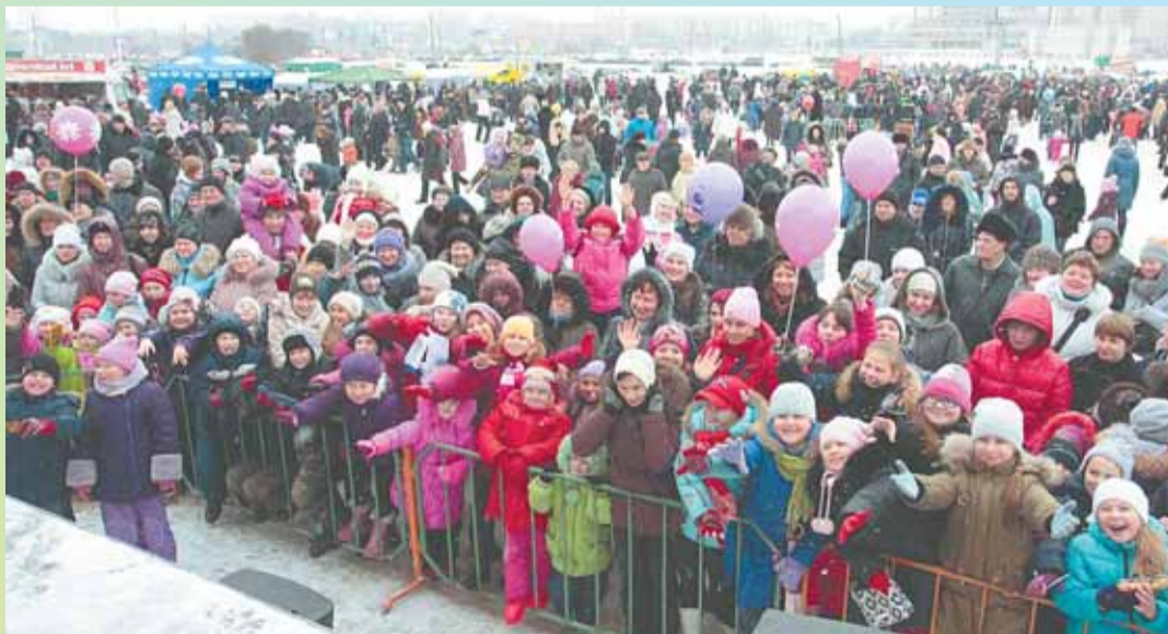
А народу-то сколько!