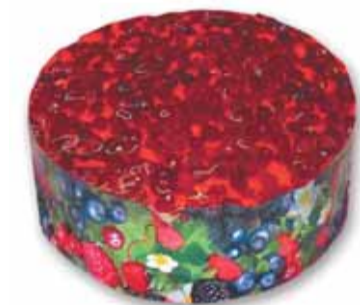
Торт «Постный с брусникой»

линия кондитерских изделий, при изготовлении которых используются продукты только растительного происхождения.