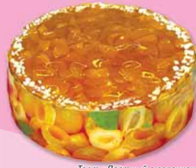
Торт «Постный с персиком»