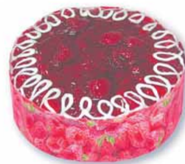
Торт «Постный с малиной»

Особое место в постном сладком меню занимает торт «Постный с брусникой». Глядя на него, сразу представляешь себя на лесной поляне, где рубиновым ковром стелется кисло-сладкая ягода. Ах, как вкусны брусничные компоты и варенья, дарящие не только уникальный вкус этой северной ягоды, но и невероятную пользу для нашего организма! Всю полноту вкуса и целебных свойств