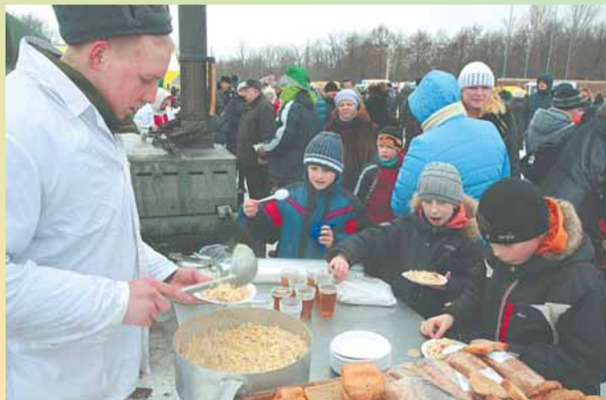
Макароны по-флотски шли на ура!