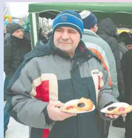
Без блинов — не Масленица!

ным. А потому неудивительно, что народ не расходился до самого окончания гуляний и с удовольствием дождался кульминации проводов зимы — сжигания чучела Масленицы.